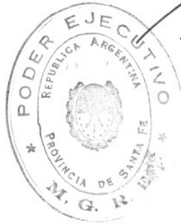
HERMES JUAN BINNER GOBERNADOR DE SANTA FE